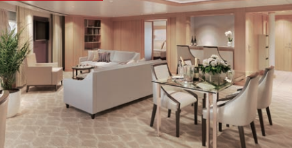
シグネチャースイート 87㎡/7階 (ベランダ55.7㎡)

船首に面した大きな窓と屋外ベランダが特徴のプレミアムな客室。随一の客室面積を誇ります。