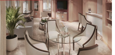
ラグジュアリースイート [A・B] 55.7㎡~87㎡/6~8階 (ベランダ8.8~36.1㎡)