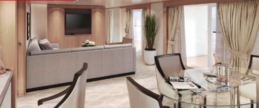
MITSUI OCEANスイート 82.4㎡/7階 (ベランダ16.8㎡)

ゆったりした広さの最上位グレードの客室は、心身ともにリラックスへと導きます。広々としたダイニングエリアと屋外ベランダ、ガラス張りのサニールームにビューバスもごございます。