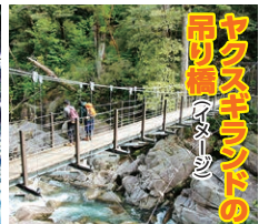
ヤクスギランドの吊り橋 (イメージ)