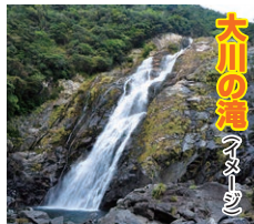
大川の滝 (イメージ)