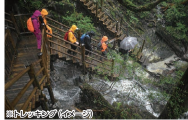
縄文杉トレッキング (イメージ)