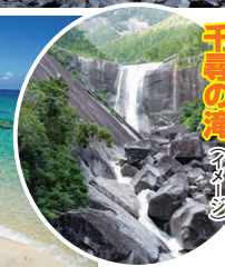
千尋の滝 (イメージ)