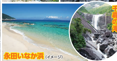
永田いなか浜 (イメージ)