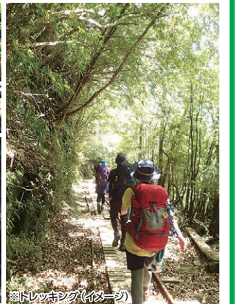
縄文杉トレッキング (イメージ)