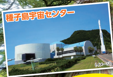
種子島宇宙センター