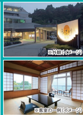
※客室の一例(イメージ)