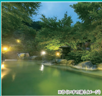
※冷たい湯(イメージ)