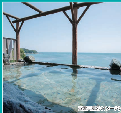
※露天風呂(イメージ)