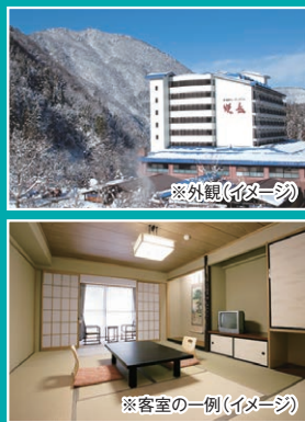
※客室の一例(イメージ)