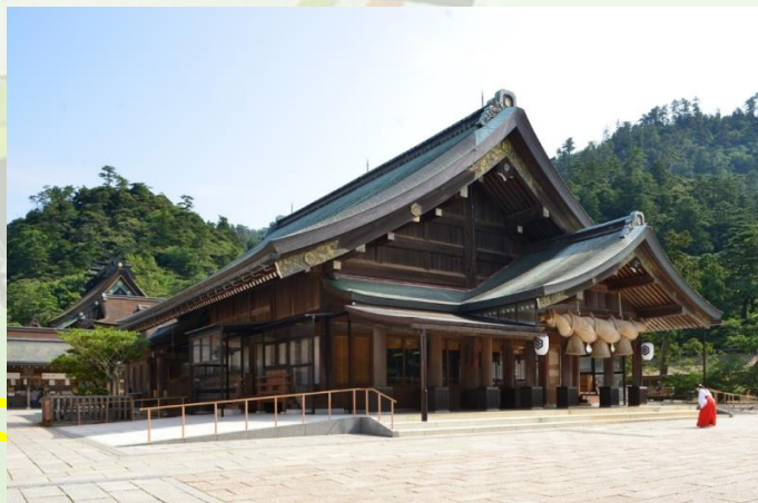
出雲大社 (イメージ)

各地—出雲(昼食)—出雲大社(自由参拝/約1時間30分滞在)—各地—備北バス本社19:00頃