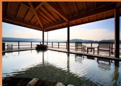
ゆったり天然温泉 日帰り入浴!