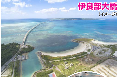
伊良部大橋 (イメージ)