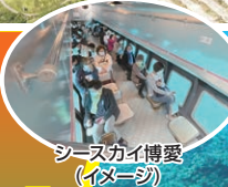
半潜水式水中観光船「シースカイ博愛」 (イメージ)