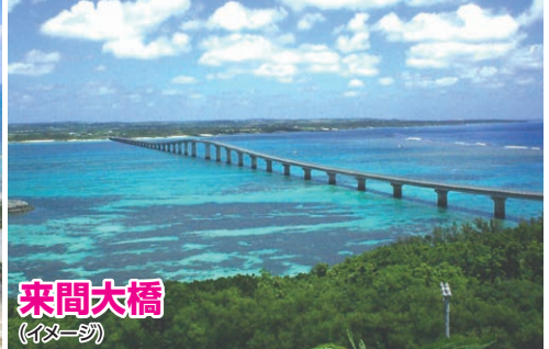
来間大橋 (イメージ)