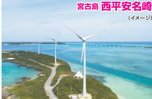
宮古島 西平安名崎 (イメージ)