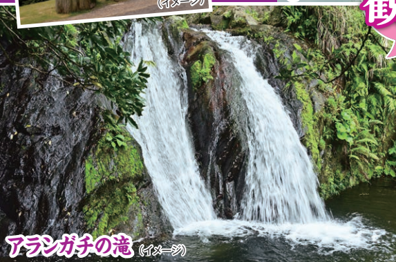
アランガチの滝 (イメージ)