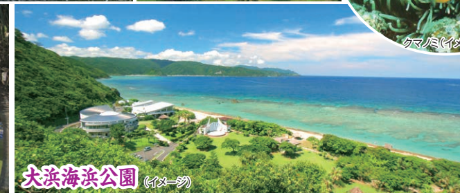
大浜海浜公園 (イメージ)