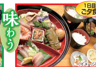
奄美の会席料理 (イメージ)