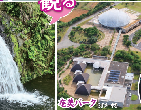
奄美パーク (イメージ)