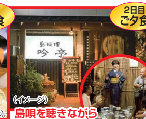
島唄を聴きながら郷土料理 (イメージ)