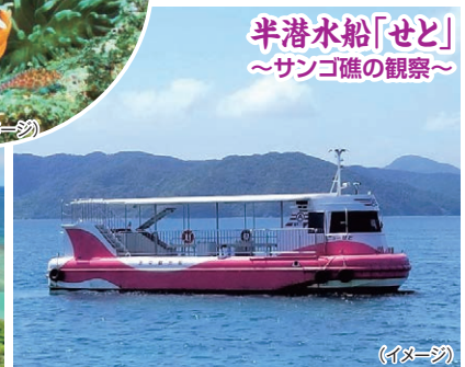
半潜水船「せと」 ～サンゴ礁の観察～