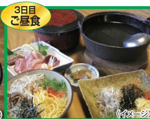
郷土料理「鶏飯」 (イメージ)