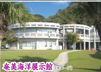
奄美海洋展示館 (イメージ)