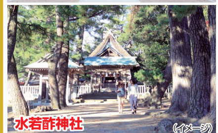
水若酢神社 (イメージ)