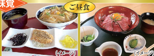
2日目:「イカ漬け丼」の昼食 3日目:人気の「ローストビーフ丼」