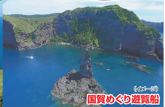
国賀めぐり遊覧船 (イメージ)