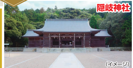
隠岐神社 (イメージ)