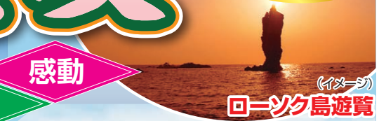
ローソク島遊覧 (イメージ)