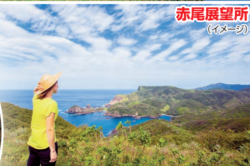
赤尾展望所 (イメージ)