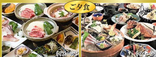
1日目:和牛付き会席 2日目:海鮮会席