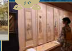
学芸員の解説付鑑賞