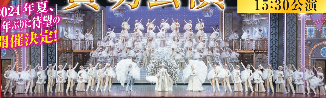
※写真は公演内容とは異なります