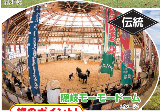
隠岐モーモードーム