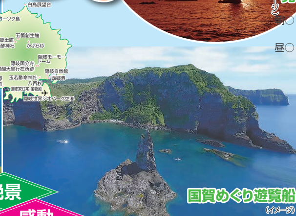
国賀めぐり遊覧船