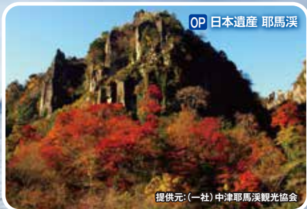
OP 日本遺産 耶馬溪