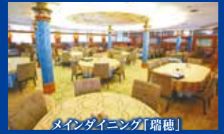
メインダイニング「瑞穂」

2~4F スーベリアツイン シャワートイレ付 / 2F: 14~18㎡ 3F-4F: 14㎡, (4F: 27㎡/車いす対応バス付)