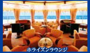
ホライズンラウンジ