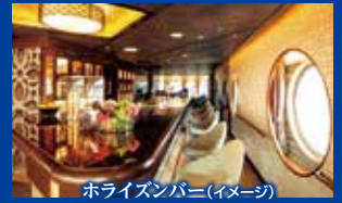
ホライズンバー(イメージ)