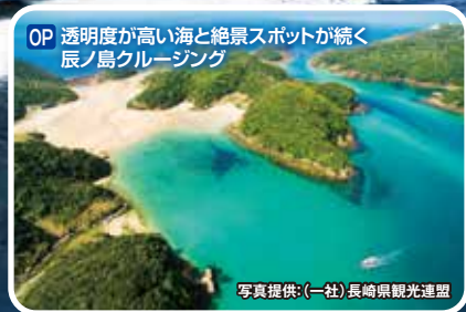
OP 透明度が高い海と絶景スポットが続く 辰ノ島クルージング