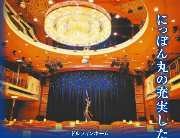
ドルフィンホール

クルーの中でも経験豊富な人材がスイートルーム専任バトラーとしてサービスを提供。ショーのお席の確保やイベントの事前確認・ご予約、お食事のご希望など、さまざまなご要望にきめ細かに対応いたします。