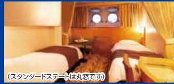
(スタンダードステートは丸窓です)

1F スタンダードステート シャワートイレ付 / 14㎡ ※フルマンベッドで3名様まで利用可能。