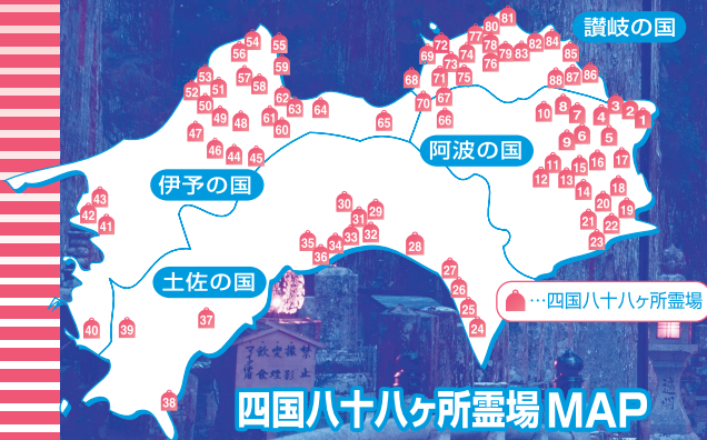
四国八十八ヶ所霊場 MAP

出会う人のぬくもりを感じながら、 一歩一歩足を進める遍路旅。 千二百年前の「お大師様の軌跡」をたどりながら 素晴らしい体験をしてみませんか。 初めての方も安心してご参加いただけます。