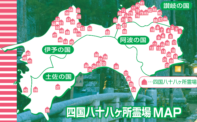
四国八十八ヶ所霊場 MAP